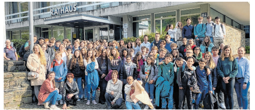
Gruppenbild vor dem Monschauer Rathaus zum offiziellen Start des Schüleraustauschs zwischen Jugendlichen aus der Nordeifel und dem französischen Bourg St. Andeol.

Leuchtendes Beispiel dafür ist der regelmäßige Schüleraustausch: In dieser Woche sind 45 französische Jugendliche in der Stadt Monschau zu Gast. »Lernt die andere Kultur kennen, findet Gemeinsamkeiten und Unterschiede, aber schaut auch, was man selbst ändern kann, damit der Andere es besser versteht«, gab